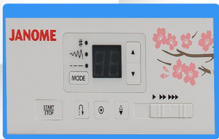
Pantalla LCD retroiluminada con botones de selección rápida.