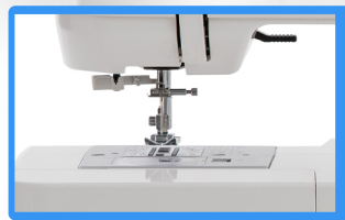
Luz LED, ancho de puntada 5mm.